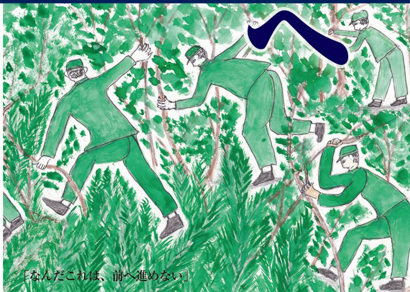
「なんだこれは、前へ進めない」