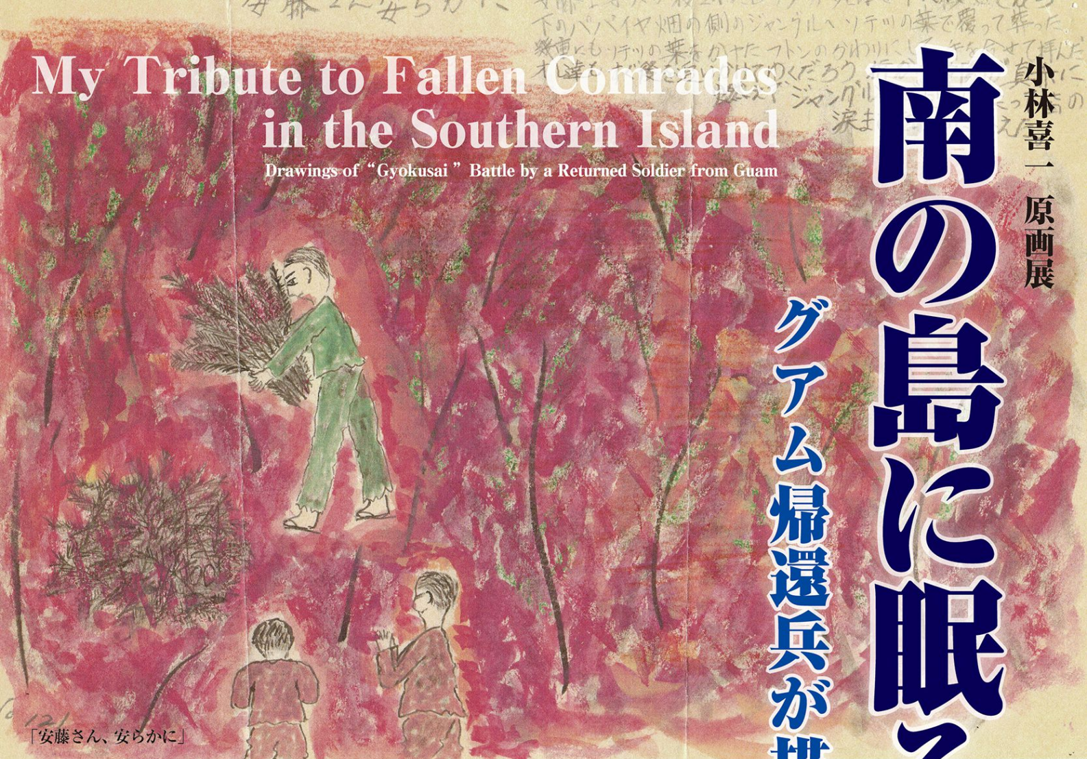
「安藤さん、安らかに」

期 間 2019年 4/27(土)~7/21(日) ※休館 6/25(火)~27(木) 会 場 靖國神社 遊就館内 特設展示場 拝 観 料 観覧には遊就館にご入場頂く必要があります。 大人=1000円 大学生=500円 (短期大学生・専門学校生などを含む) 中学・高校生=300円 小学生=無料 ◎靖國神社崇敬奉賛会、遊就館友の会会員は無料となります。 開館時間 午前9時~午後4時30分 ※入館は閉館の30分前まで みたままつり期間中 7/13(土)~16(火)は 午前9時~午後8時半まで開催 ※入館は閉館の30分前まで