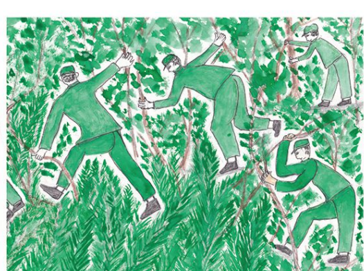
「なんだこれは、前へ進めない」